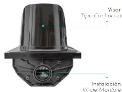
VISTA SUPERIOR SEMÁFORO 20 CM