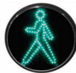
PEATÓN ANIMADO 30 cm.