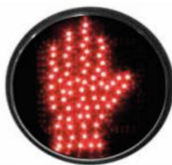
MANO / CRONÓMETRO 30 cm.